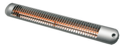
BY 802 S Wickeltischstrahler

Einmal kurz am Schnürchen ziehen und schon wird's wohlig warm – so einfach funktionieren die Infrarot-Strahler von Dimplex! Denn sie erwärmen nicht die Luft, sondern strahlen punktuell Wärme an ihre unmittelbare Umgebung ab. Ob Wickeltisch, Werkbank oder Sitzgruppe – überall dort, wo es bei Bedarf schnell warm werden soll, ist ein Infrarot-Strahler perfekt. Insbesondere im Badezimmer ist er eine ideale Ergänzung. Um die Wärme besonders effektiv nutzen zu können, lassen sich die Infrarot-Heizstrahler von Dimplex, obwohl fest an der Wand montiert, um bis zu 40° schwenken und dadurch optimal auf den Nutzungsbereich einstellen. Sie sind daher eine perfekte, punktuelle Ergänzung zur Vollheizung – vor allem dort, wo schnell und zuverlässig besonders viel Wärme benötigt wird. Nutzt man für die Infrarot-Heizstrahler ausschließlich Strom aus regenerativen Quellen ist ihr Betrieb sogar komplett klimaneutral!