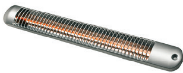
BK 1202 S Langfeldstrahler